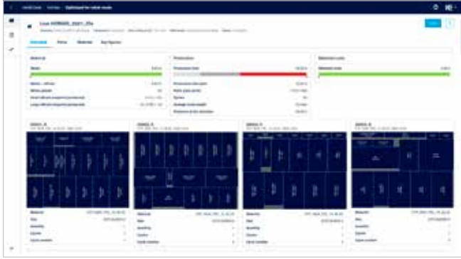
Dati di produzione dettagliati